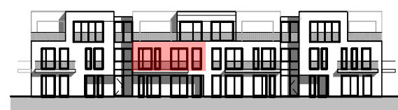
Südsicht Haus 02+03