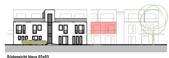
Südsicht Haus 02+03